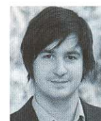
Autor André Bossy, HR Business Partner Europe & HR Projects, Nationale Suisse, andre.bossy@ nationalesuisse.ch