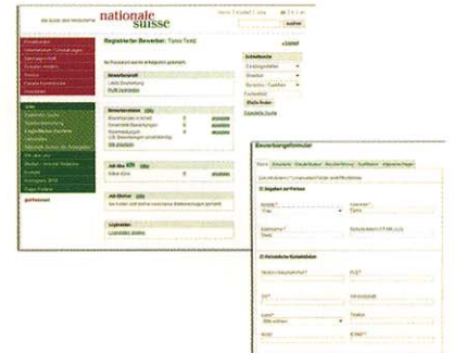
Das neue Bewerbermanagement-System fügt sich nahtlos in das bestehende Webdesign ein.

me genannt) ausgegeben. iFrames werden unter anderem dazu verwendet, um auf einer Website externe oder zusätzliche Inhalte als selbstständiges Dokument darzustellen. So kann es im Look der umgebenden Homepage erscheinen. Dieses Vorgehen hatte den Vorteil, dass der Hersteller des bei Nationale Suisse eingesetzten Content-Managementsystems nun lediglich die Einbindung von iFrames in sein System ermöglichen musste. So passt sich die Online-Oberfläche des Bewerbermanagementsystems einwandfrei an Design und Layout des gesamten Internetauftritts an. Dieser Ansatz sorgt für ein homogenes Erscheinungsbild aller Funktionsbereiche innerhalb des Corporate Design-Umfelds, also in der Eingabemaske des Bewerbungsformulars oder dem Bewerberprofil und den Suchergebnissen (Abbildung 2). Durch diese Lösung kann Nationale Suisse jetzt Stellenangebote schnell und einfach auf die Unternehmenswebsite stellen – vorher war man darauf angewiesen, jede Ausschreibung per Hand in das Content Managementsystem zu übertragen. Mit der Entscheidung für die BeeSite ist die Nationale Suisse bislang vollauf zufrieden. Die Bearbeitungszeit pro Bewerbung konnte deutlich reduziert